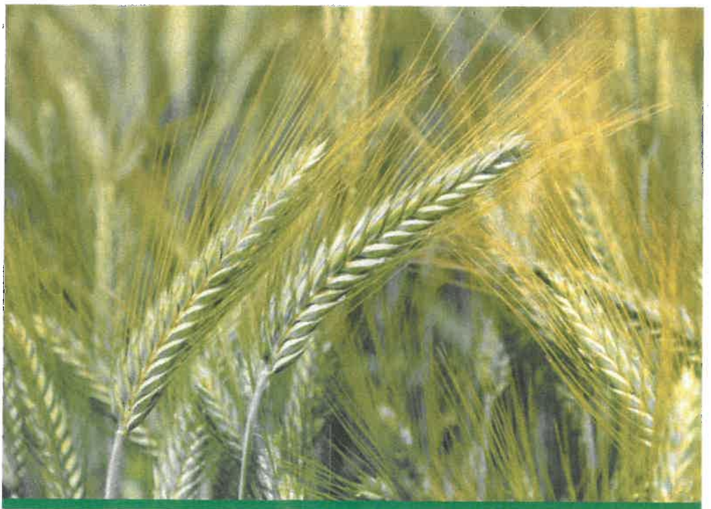
GK Maros új fajta kalásza

A GK Szemes, a piacvezető hazai fajta a hagyományos és